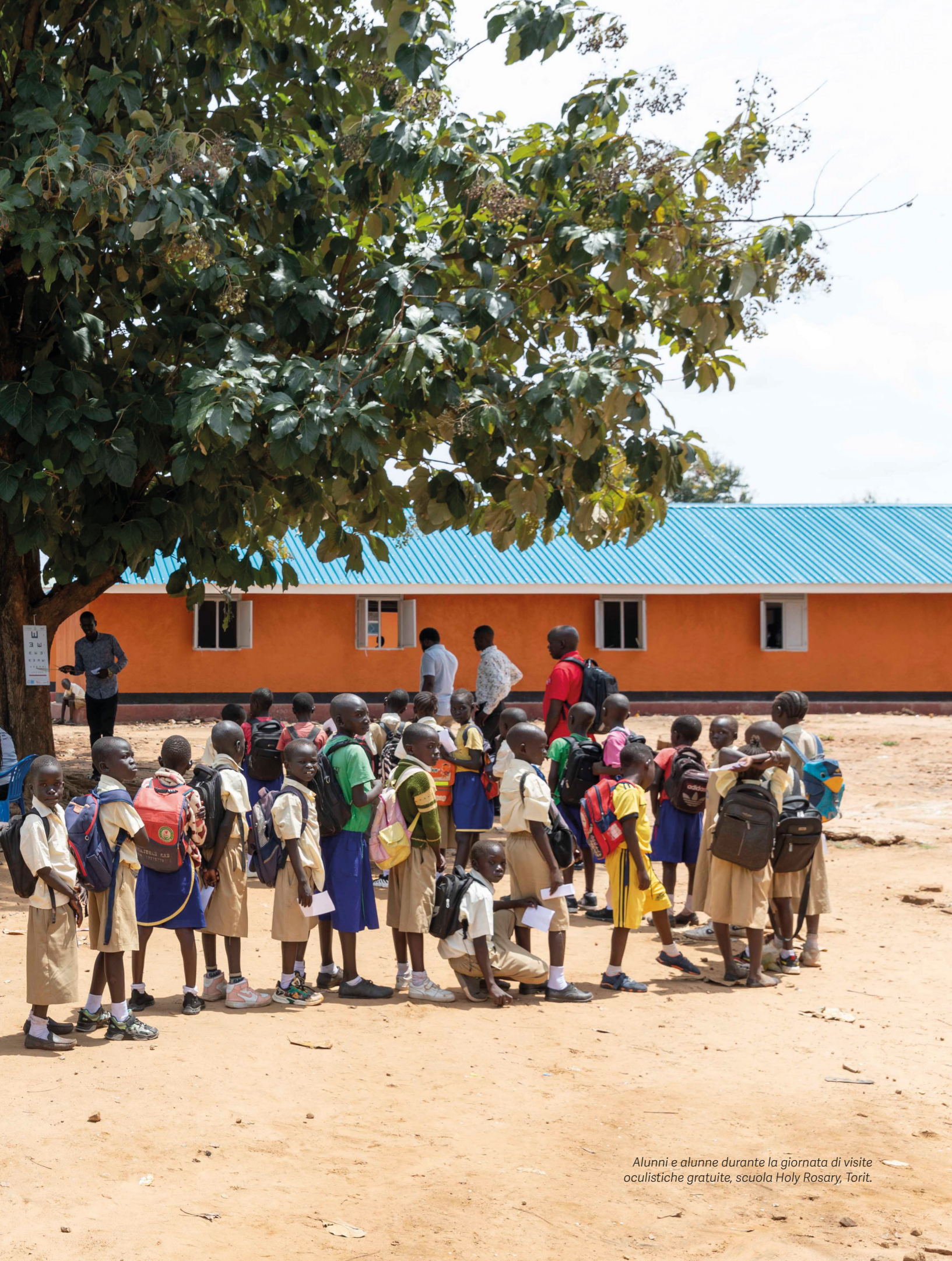
Alunni e alunne durante la giornata di visite oculistiche gratuite, scuola Holy Rosary, Torit.