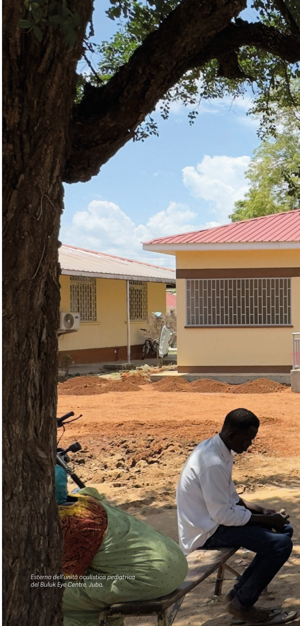
Esterno dell'unità oculistica pediatrica del Buluk Eye Centre, Juba.