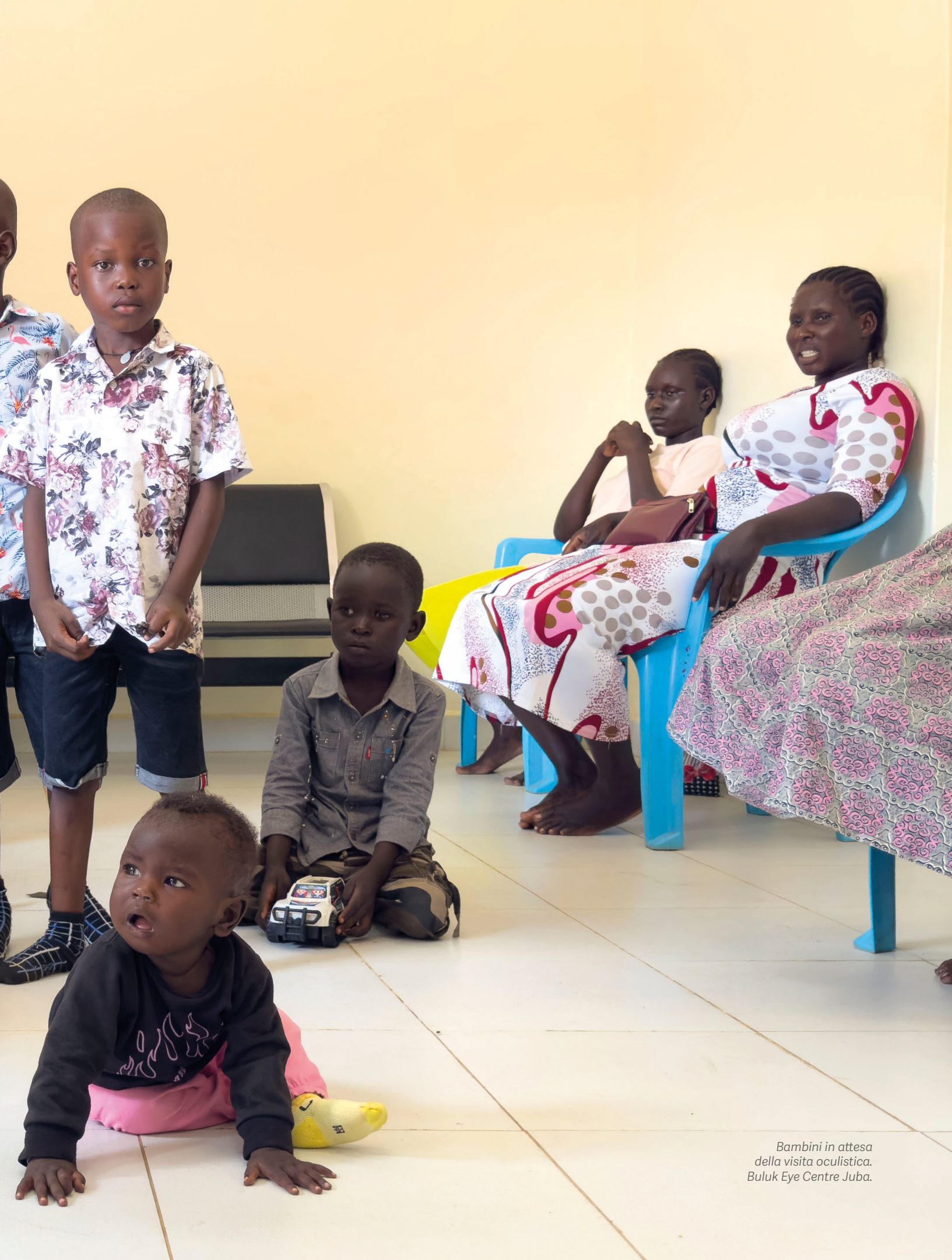
Bambini in attesa della visita oculistica. Buluk Eye Centre Juba.